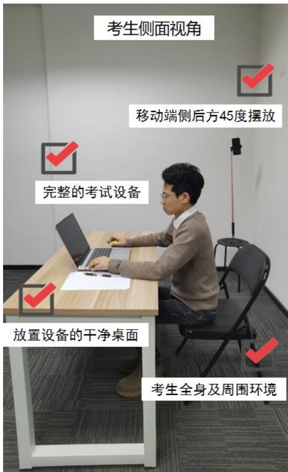
图四：考生侧面视角图