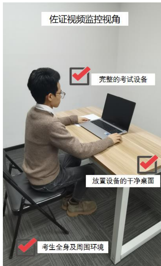
图五：佐证视频监控视角图