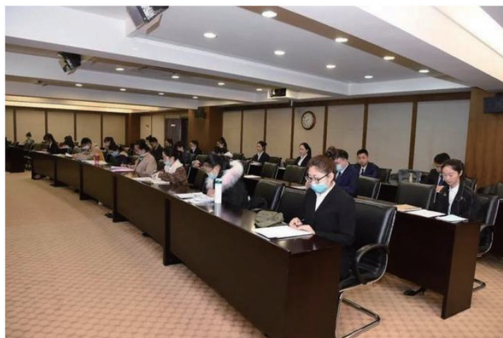
上图：半结构化真实候考室