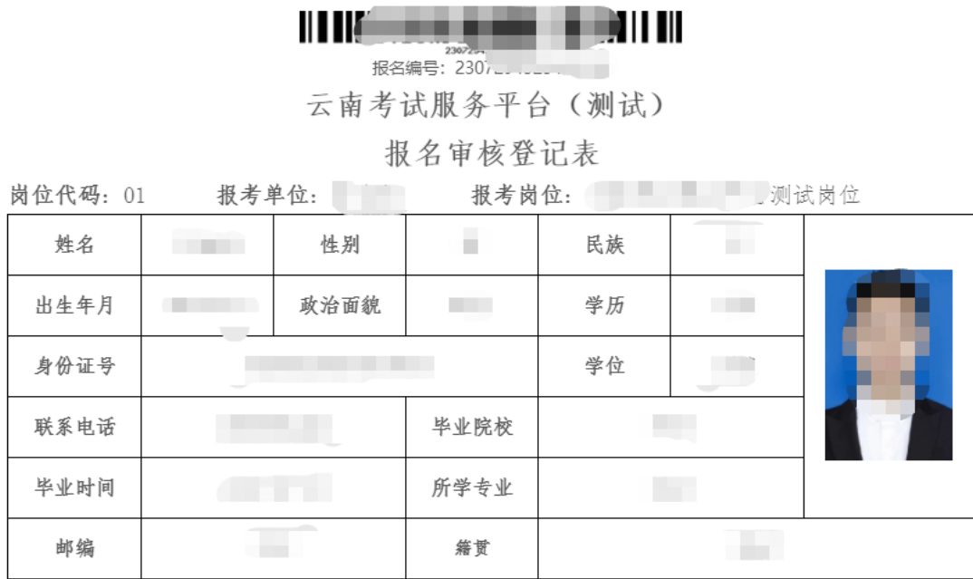
(图例：考生查看或打印自己的报名表)