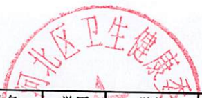
2023年天津市河北区卫生健康系统公开招聘事业单位工作人员笔试成绩名册