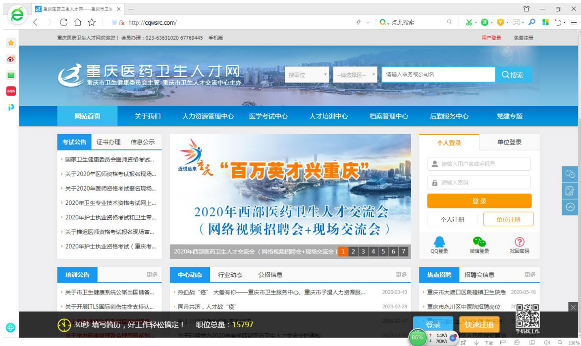
如图1 重庆医药卫生人才网首页所示

1) 求职者打开重庆医药卫生人才网（ http://www.cqwsrc.com ）一点击2020年西部医药卫生人才交流会图片进入专题页面一点击视频招聘会入口一进入网络招聘会会场，点击网络视频招聘会端口→选择参加的网络视频招聘会→进入会场。