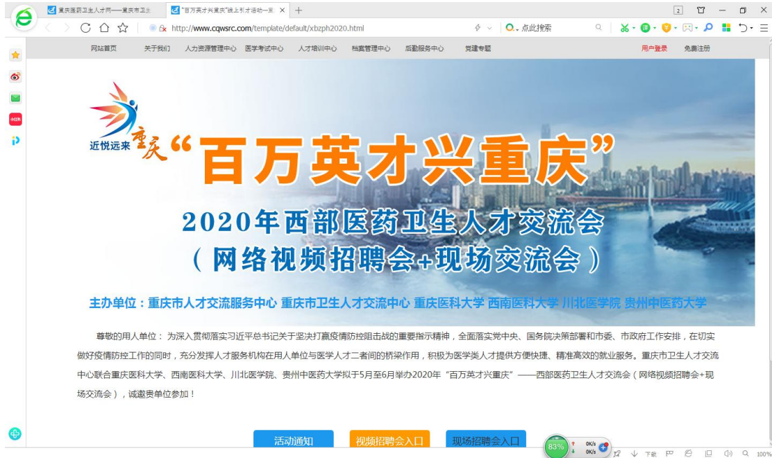
如图3 2020年西部医药卫生人才交流会网络视频会页面