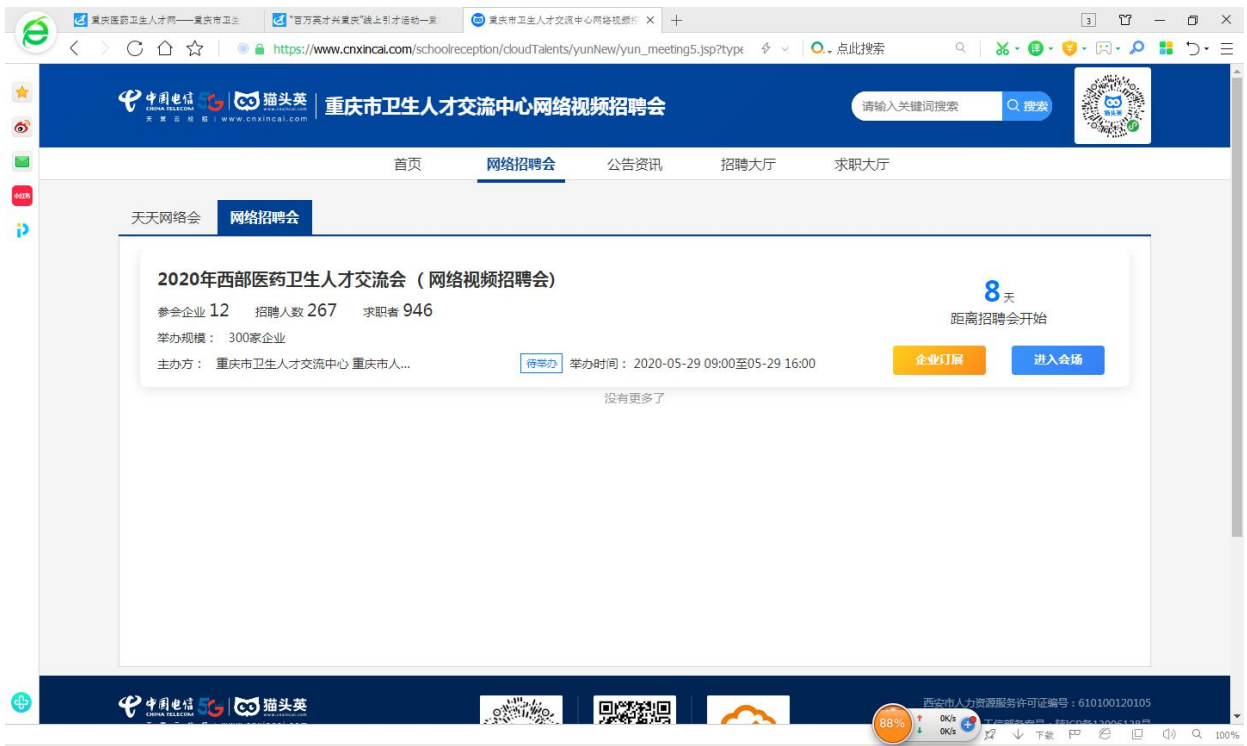
如图4 进入招聘大厅