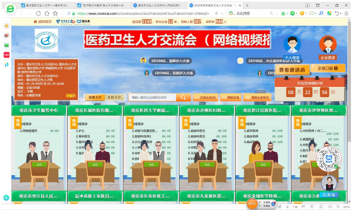
如图5 招聘大厅所示